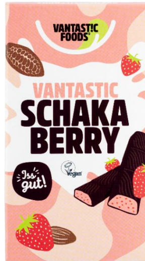
Vantastic foods VANTASTIC SCHAKABERRY, 100 g mit Mindesthaltbarkeitsdatum: 16.09.2022 / 01.10.2022

Vom Rückruf betroffen ist der folgend genannte mit den MHD-Daten und Chargennummern: